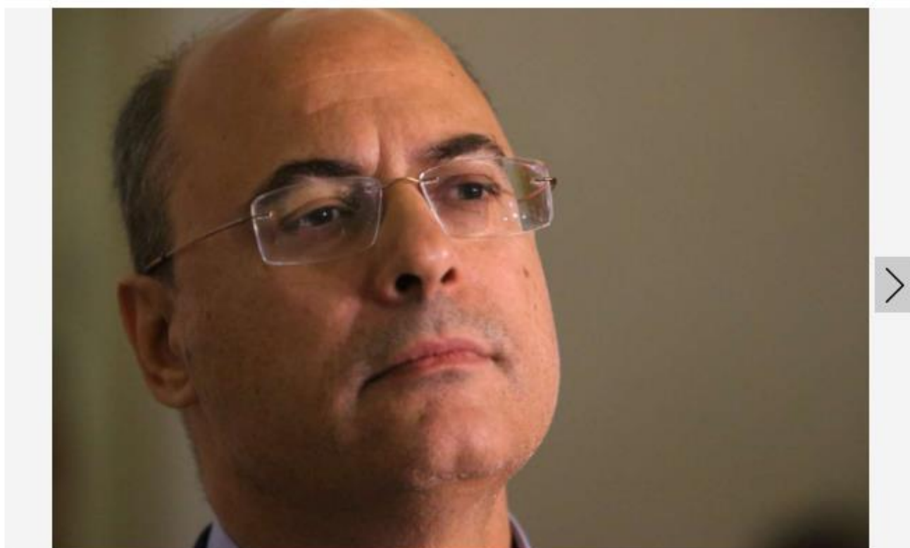
Governador eleito, Wilson Witzel