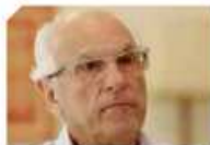
LUIZ CARLOS GUEDES PINTO ex-ministro da Agricultura