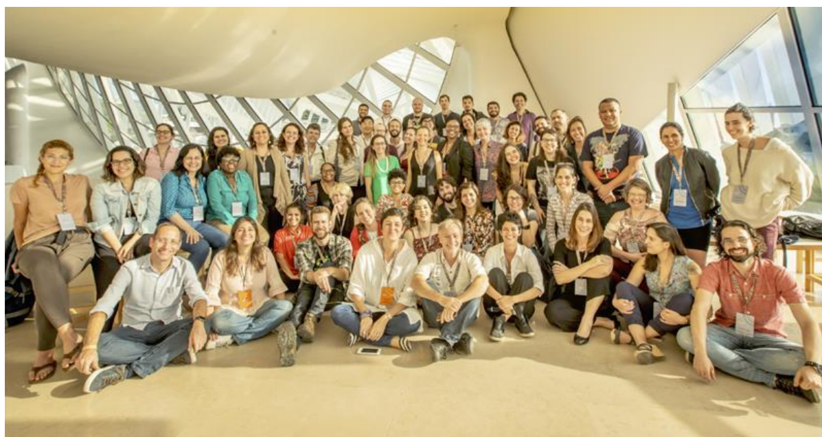
Participantes do evento Camp Serrapilheira realizado em setembro de 2018 no Museu do Amanhã, Rio de Janeiro

Após um ano, os 24 projetos serão reavaliados e três deles poderão receber até R$ 1 milhão, por três anos. Além de receber ajuda financeira, os beneficiados participarão de treinamentos, workshops e eventos de integração, como o Encontros Serrapilheira.